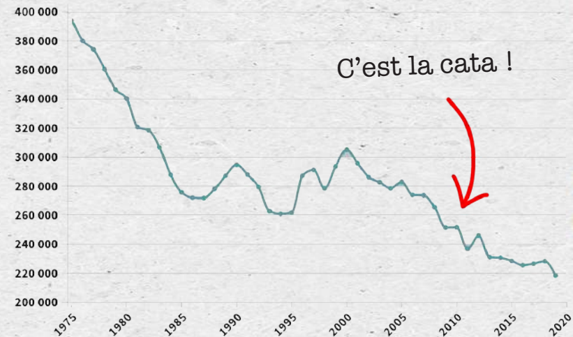
Nombre de mariages en France

Le conseil municipal soutient le local et propose un service de première nécessité, celui de rendre l'union en circuit court accessible à toutes et tous.